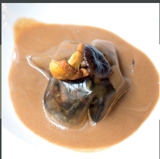
Raviolis de aromáticos con setas, verduritas y su crema rebozuelo (Cantharellus cibarius), (Pleurotus eryngi)