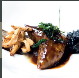
Chipirón relleno con guiso trompeta de los muertos (Craterellus cornucopioides) y pie de mouton (hyndum repandum)