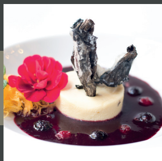
Frutos rojos y setas